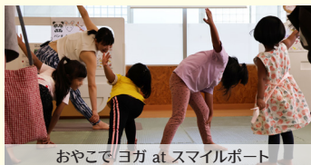
おやこでヨガ at スマイルポート