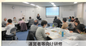
運営者等向け研修