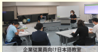
企業従業員向け日本語教室