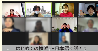
はじめての横浜～日本語で話そう

地域子育て支援拠点との共催で行いました。子育て支援の場で実施することで、外国人親子への継続的な支援を目指しています。