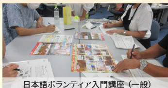
日本語ボランティア入門講座（一般）