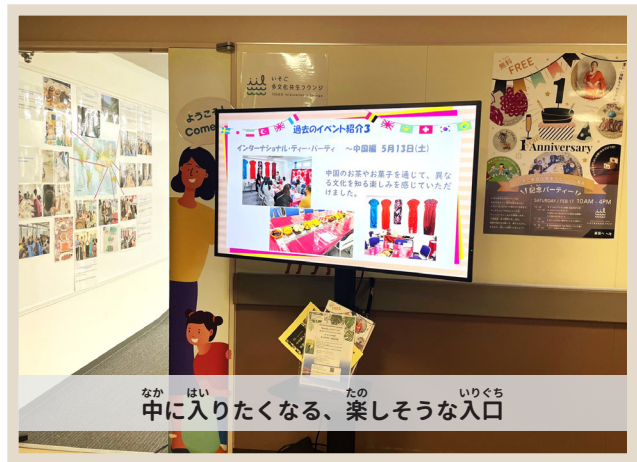
中に入りたくなる、楽しそうな入口