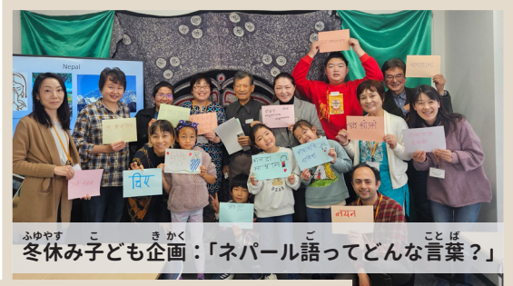
冬休み子ども企画：「ネパール語ってどんな言葉？」

2023年2月に、新しくオープンしました。暮らしのこと、出産・育児、子どもの学校のことなど、日本語・英語・中国語で相談ができます。楽しく交流しながらお互いの文化を知る機会として、「International Tea Party」や親子の交流の場「ISOGO Community Playgroup」を毎月開催しています。また、防災訓練での通訳、区民文化センターや団地のイベントに参加するなど、地域活動を大切にしています。