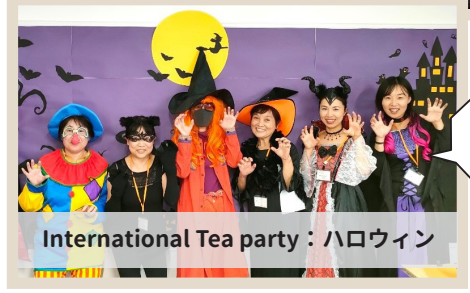
International Tea party : ハロウィン

また、やさしい日本語でおしゃべりをする「木曜夜のおしゃべり会 (Thursday Night Chatting Club)」を、毎週開催しています。日本語が話せなくても大丈夫。いろいろな国の人が、楽しくしゃべることを目的としています。また、毎月最後の木曜日は、英語でおしゃべりをします。 * 予定は変わることがあります。