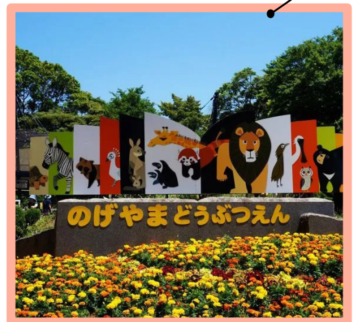
※2019年夏頃に撮影。入口の飾りは、季節ごとに変わります。

ライオンやレッサーパンダなど、 たくさんのかわいい動物がいま す。初めて行った時、「本当 はじめて行ったとき ほんとう に無料なの？」とびっくり しました。子どもたちと、 なんかい い どうぶつえん 何回も行きました。動物園 の周りには、美味しいレス トランがたくさんあります。 よこはま しちゅうおう と しよかん ちか 横浜中央図書館も、近くに あります。動物を見て、ごはん を食べてたら、好きな本を読みます。