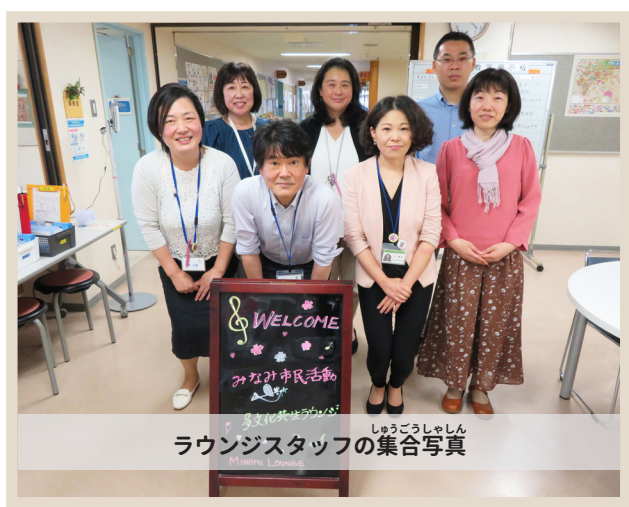
ラウンジスタッフの集合写真

みな ちいき ぼしょ 皆さんと地域をつなぐ場所 地域の外国人の皆さんに、生活に必要な情報を提供しています。日本語の他、中国語、英語、タイ語、タガログ語で相談ができます。自慢は、秋に開かれる大きなお祭り「みんなの『わっ!』フェスタ」です。たくさんのプログラムがあって、歌ったり踊ったり…地域の人みんなで、楽しく交流します。ラウンジは、お肉やお魚など、お買い物が楽しめるアーケード「横浜橋商店街」の近くにありす。ぜひ、遊びに来てください！