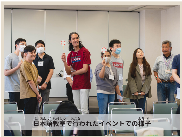
日本語教室で行われたイベントの様子

大人向けの教室は6つ、子ども向けの教室は7つあります。たくさんあるので、あなたの目的や曜日合った教室を選ぶことができます。勉強だけではなく、ハイキングや交流会など、楽しい行事もあります。お祭り「みんなの『わっ!』フェスタ」の中で、「日本語スピーチ」を行います。さまざまな国の方が、楽しい話題をテーマに、学んだことや感じたことなどを日本語で発表します。