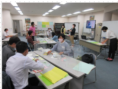
第7回目対面授業の様子

第7回の対面授業ではグループで協力して川柳づくりを行うことで、コミュニケーションを深めることができたため、その後のオンライン授業でも学習者同士で質問しあったり、分からない時には助け合ったりする姿もみられました。