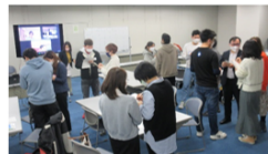
ニュースレター (2023年2月2日発行) より

今回の教室では、第5回と第10回を対面開催としています。第5回(1/18)では、実際に会って意見を交わしたり、チームで協力してかるた・クイズ大会に挑戦しました。クイズ大会では、各国や横浜・日本文化に関するクイズを出しました。「ミャンマーの日焼け止めの名前は? (①タナカ②サトウ③コンバクト)」など、思わず首をかしげる問題も出ましたが、それぞれの国について理解し合う良い時間となりました。第5回は教室の折り返し地点でしたが、直接会って話すことでクラスメイト同士親しみがより増したように感じられます。 ※クイズの答え①