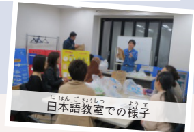
日本語教室の様子