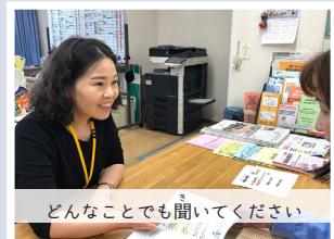
どんなことでも聞いてください

家族やお友だちに、近くの国際交流ラウンジを教えてください。生活相談や日本語の勉強、交流イベント、ボランティアの参加など、いろいろなことができます。住んでいる区以外のラウンジも利用できます。