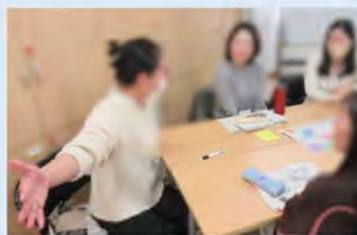
すごろくを使った、学習者との交流活動