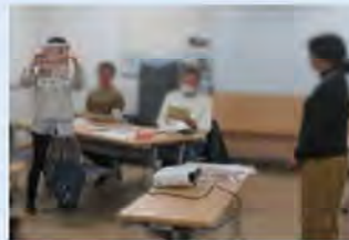
チラシを使った 交流型活動の体験