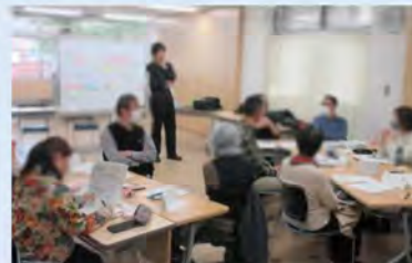
各々の質問に対し意見交換